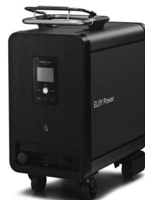
図3 パワーイレ外観

安全性に関しては内蔵する電池セルの絶対的な安全性に加え、遠隔監視システムを内蔵。出荷した全てのシステムを遠隔監視することにより、故障のみならず故障の兆候も検知できる高度なシステムが構築されている。