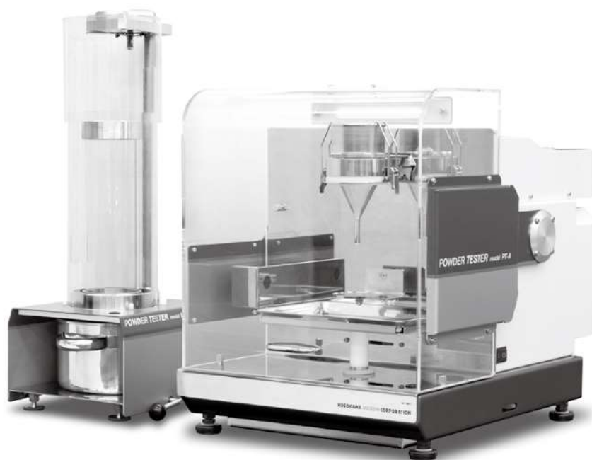
写真1 粉体特性評価装置パウダテスタ (PT-X)

本課題に対しては、データを詳細に分析する「統計解析」を用いた手法が最適であると考えられる。しかしながら統計解析を用いた解析手法は、品質管理などを除くと一般的とは言えず、独自で使用するには高度な勉強が必要となる。そこで今回我々は、敷居が高いとされる統計解析手法を一般化すべく、粉体特性評価装置パウダ