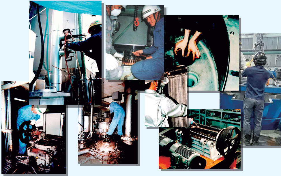
現地メンテナンス