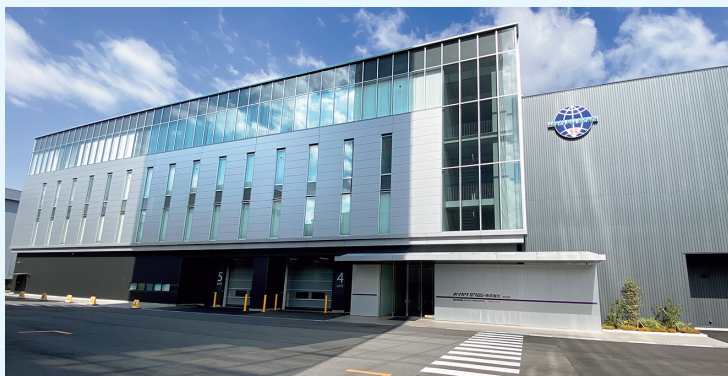
大阪新工場 外観写真