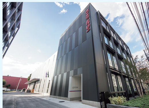
東京事業所 外観写真