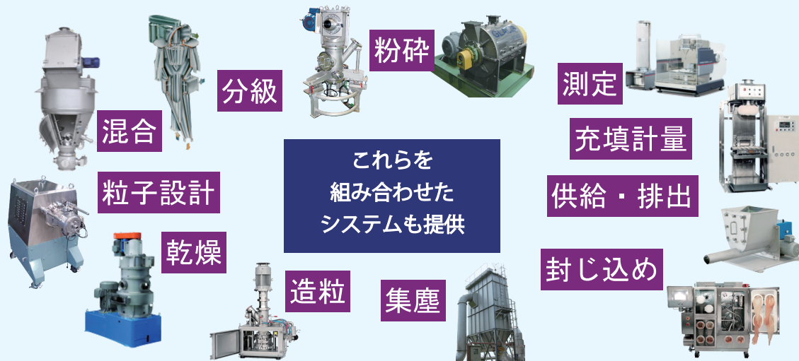
当社粉体プロセス機器の例