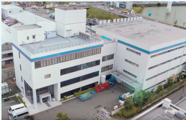
大阪テストセンター（大阪府枚方市）