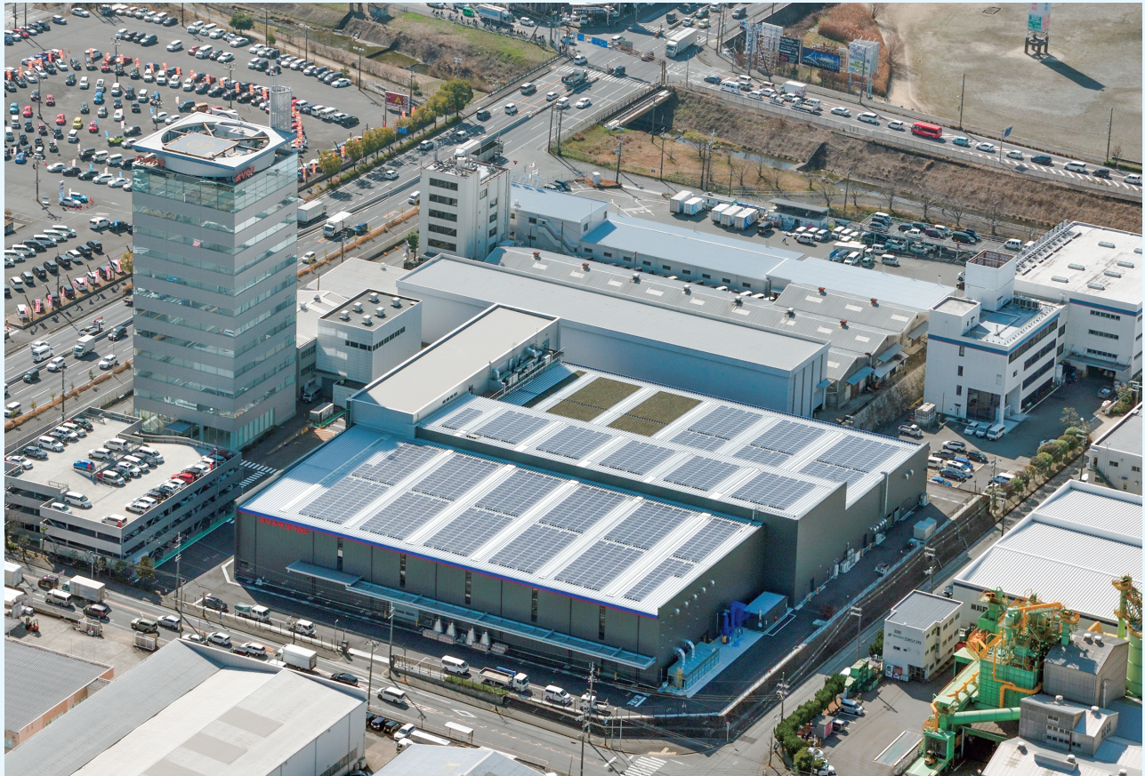
ホソカワミクロン大阪本社（手前側が太陽光パネルを屋上に設置した新工場）