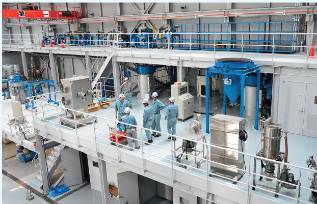
東京テストセンター内部（千葉県柏市）