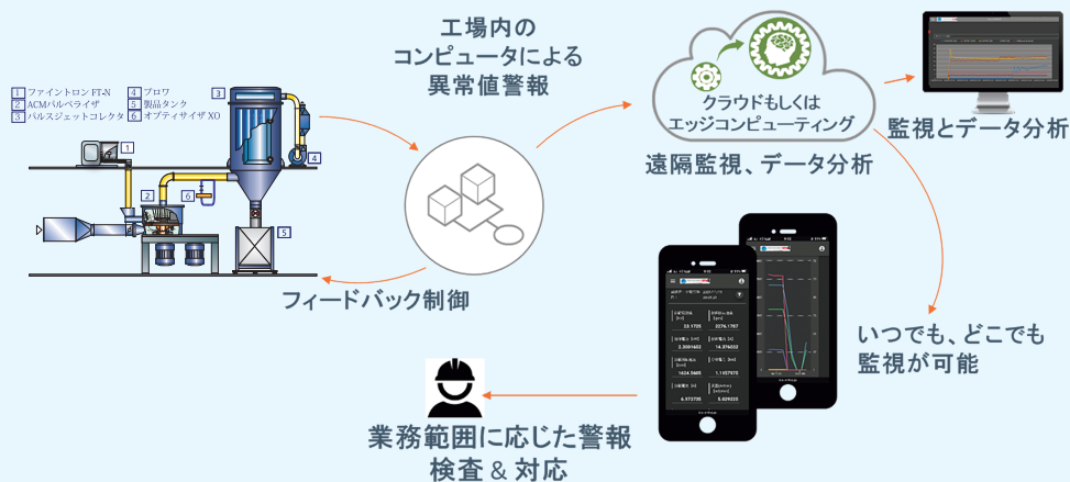
HOSOKAWA GEN4 (商標登録第 6187953) サービスの概要