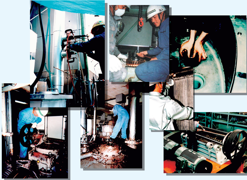
現地メンテナンス