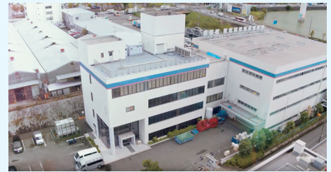
大阪テストセンター