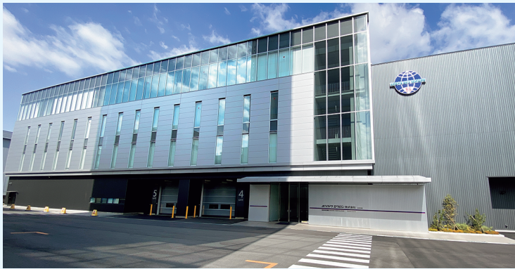
大阪新工場 外観写真