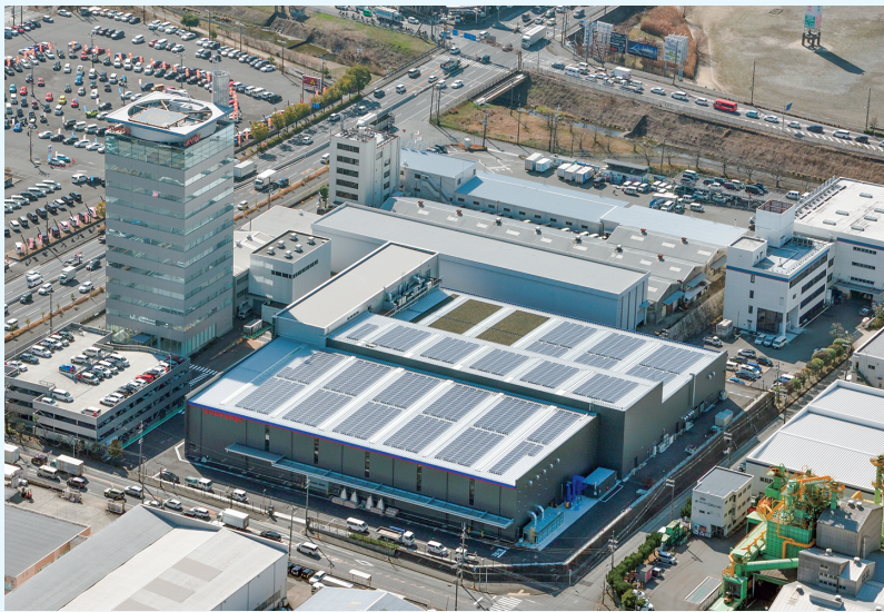
ホソカワミクロン大阪本社（手前側が太陽光パネルを屋上に設置した新工場）