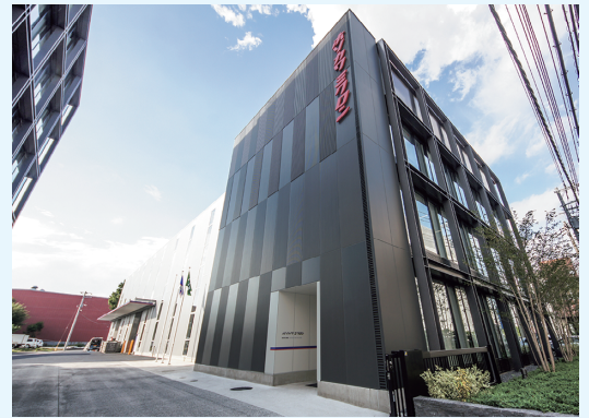
東京事業所 外観写真

においても3次元測定機などを活用しながら、高性能、高品質な製品を送り出しています。