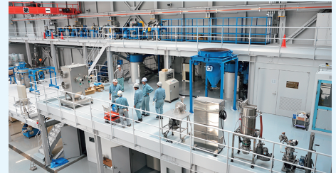
東京テストセンター内部