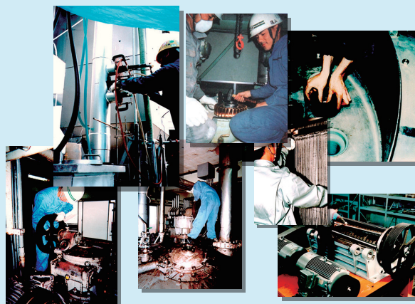
現地メンテナンス

お客様の要望を伺い把握した上で、粉体ハンドリングのノウハウや経験を活かし、適切な改造を提案