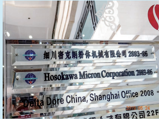
オフィスビル入口の案内板