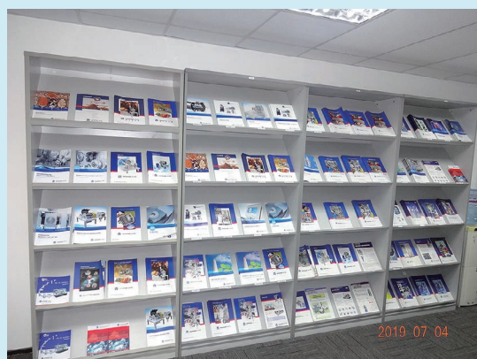
オフィス内にある各グループ会社の製品のカタログ類

中国市場は、二次電池材料、カーボンブラック、PTFEなどをはじめとするケミカル分野、超微粉碎の炭酸カルシウムを中心にしたミネラル分野、CCM（細胞培養液）などの医薬分野などお客様からいた