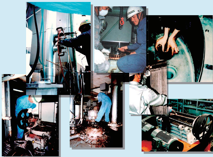
現地メンテナンス