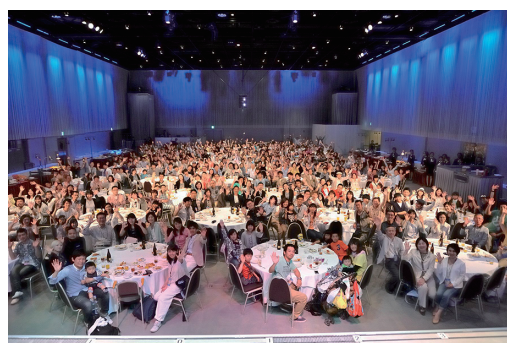
図5 関西地区社員向け祝賀パーティー（USJ）

パーティーにおける開会ご挨拶で細川社長が強調したのは、従業員の日頃の努力とご家族の陰の支えに対する心からの感謝でした。なお、関西地区は、参加人数が多過ぎて会場に入りきれないため、5月と6月に分かれての開催となりましたが、いずれの会場もパーティーはもちろん、多くのご家族が、朝のオープンから夜のクローズ間際まで様々なアトラクションやイベントを賑やかに楽しんでいました。