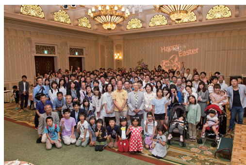
図6 関東地区社員向け祝賀パーティー（TDL）