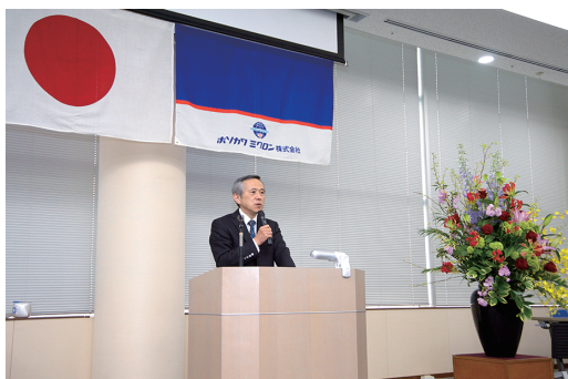
図3 創業100周年記念式典