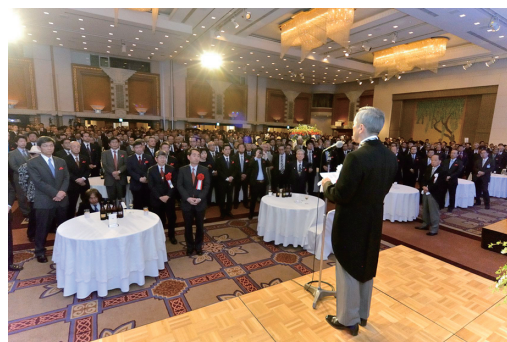
図4 創業100周年記念“感謝の集い”

念頭に置き、責任感と積極性をもって、現状に甘んずることなく、チャレンジし、前進していかねばならない』と決意を述べられました。続いて、国際表彰をはじめとする各賞の授与式、特別専門職認定証授与式があり、万歳三唱で式典を締めくくりました。