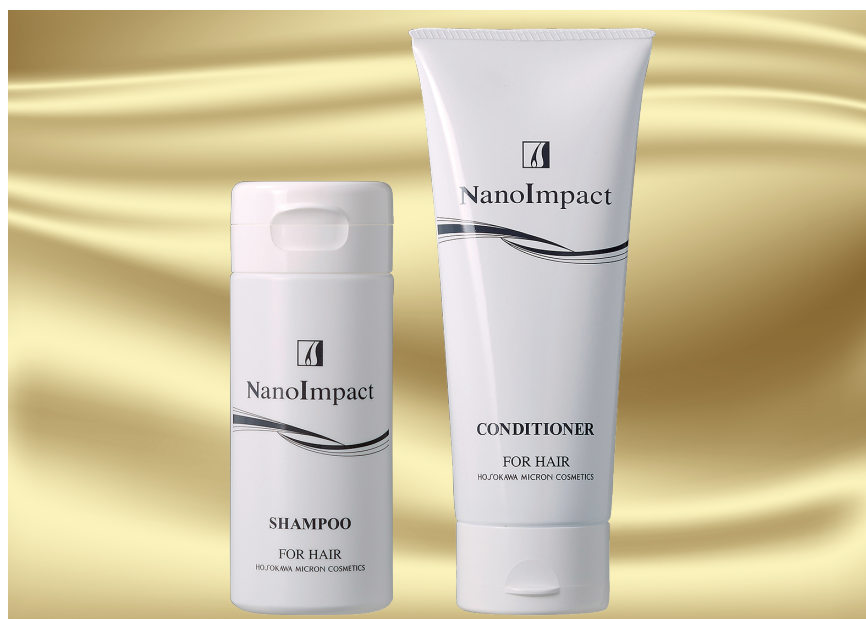
左) 薬用ナノインパクト シャンプー (医薬部外品, 150 g) 右) 薬用ナノインパクト コンディショナー (医薬部外品, 150 g)