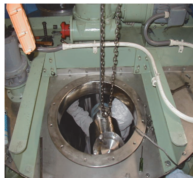
現地メンテナンス