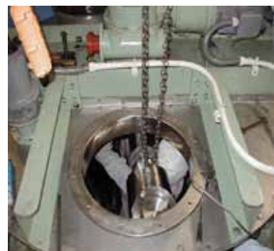
現地メンテナンス