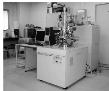
集束イオンビーム加工観察装置

冷陰極電界放出型電子銃およびセミアンレンズを組み合わせた超高分解能走査電子顕微鏡です。エネルギー分散型X線分析装置を用いて元素分析も可能です。