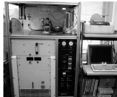
帯電性の評価装置 (イースパートアナライザ)

粉粒体の圧縮と引張強度を連続的に測定することができます。成形した顆粒の圧縮破壊強度や圧密下での粉体の付着性・凝集性を評価することが可能です。