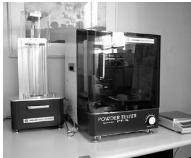
流動性・噴流性の評価装置 (パウダテスタ)

粉体を取り扱うプロセスにおいて、その物性を把握しておくことは特に重要となります。当社では粉体の流動性・噴流性・付着性・凝集性・帯電性・濡れ性の指数を独自開発の計測機器によって解析・評価しており、以下にこれらの測定器についてご紹介いたします。