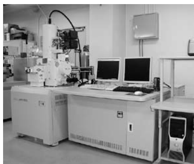
電界放出型電子顕微鏡

TEM像観察、EDS分析、ナノビーム回折、収束電子回折の4つの照射モードの中から、目的にあった最適の条件を選択できる高分解能電子顕微鏡です。