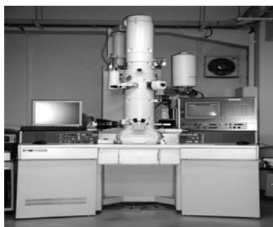
透過型電子顕微鏡

ここでは、この受託分析ビジネスにおける当社の代表的な測定・分析・評価装置をご紹介します。