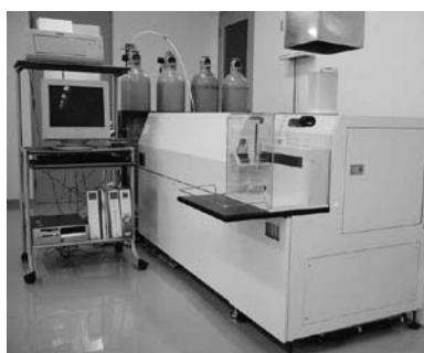
高周波プラズマ発光分析装置

イオンビーム (Ga) を用い、SEMやTEM用の試料断面作製が高精度・高速で可能です。また、結晶方位の違いによるチャネリングコントラストも観察できます。