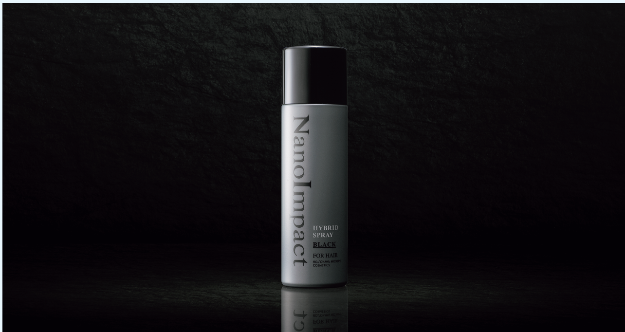
2023年6月1日に発売したナノインパクト®ブランドの新商品 「ナノインパクト® ハイブリッドスプレー（ブラック）」

また、2023年6月に「ナノインパクト®」ブランドから、新たに「ナノインパクト® ハイブリッドスプレー」を発売致しました。このスプレーを頭髮に使用すると、シリカの微粉末が髪に付着し、1本1本の髪が太く見えることで、視覚的に薄毛を目立たなくすることを可能にした「増毛スプレー」です。